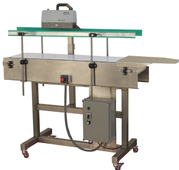
GEHO 350/5.6 (Artikelnr. 09 001) mit Transportband (Artikelnr. 09 102)

Der zu verschließende Beutel wird von rechts in das Gerät eingeführt, bis die rotierenden Teflonbänder den Beutel erfasst haben. Der Beutel wird dann automatisch durch das Gerät transportiert und verschweißt. Es ist darauf zu achten, dass die Beutel waagrecht in das Gerät eingeführt werden, da sonst die Schweißnaht verlaufen kann.